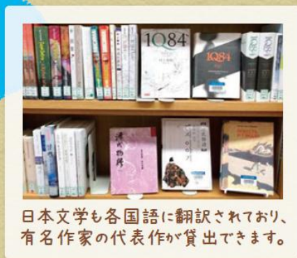
日本文学も各国語に翻訳されており、有名作家の代表作が貸出できます。

鳥取県立図書館は中国・韓国・ロシアの図書館と交流をしています。児童書・日本語学習図書・日本で生活に役立つ図書など、中国語・ハングル・ロシア語のさまざまな分野の図書が揃っています。