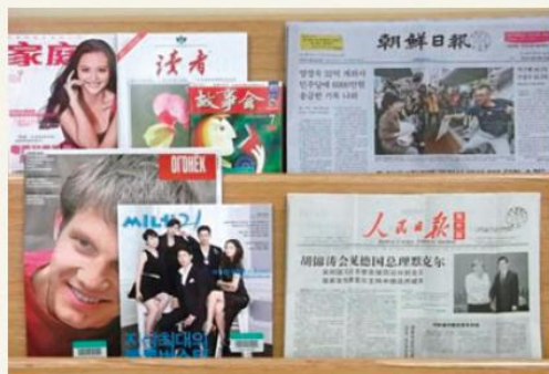
新聞・雑誌は随時最新号が各国から送られてきます。