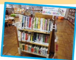
「読みメン」コーナー

「読みメン」とは、子どもに絵本を読む男性のこと。この言葉には、お父さんやおじいさんにも、もっと子どもと絵本を楽しんでほしいという願いが込められています。お父さんが絵本を読むことは、お子さんとの楽しみになることはもちろん、お母さんのゆとりの時間にもつながります。家族みんなが絵本でHAPPYに！！