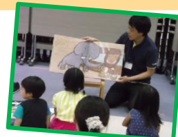
読みメンのおはなし会