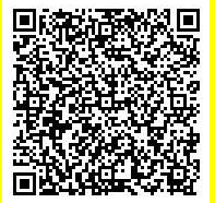
とっとり電子申請サービス