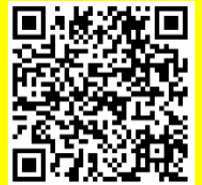
県立図書館ホームページ