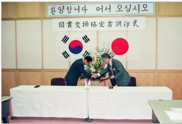
図書交換協定書調印式(鳥取県立図書館)

鳥取県と韓国江原道との交流は、鳥取県立図書館で保管されていた掛軸「漂流朝鮮人之図」の発見がきっかけとなり、発展してきました。鳥取県と江原道は平成 6(1994)年に友好提携を締結、同年、鳥取県立図書館は江原道春川市立図書館に図書館交流を呼びかけ、図書交換を始めました。平成 9(1997)年 6 月には「図書交換に関する協定書」を締結し、以来毎年 100 冊程度の図書・雑誌を交換しています。