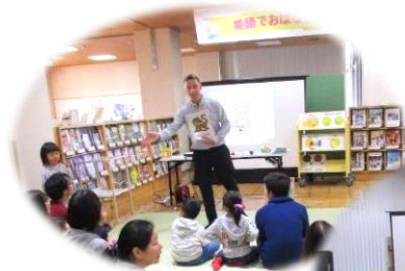
英語でおはなし会