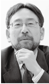
藻谷 浩介氏 (日本総合研究所調査部 主席研究員)

1964年生まれ、山口県出身。平成の合併前3,200市町村のすべて、海外71ヶ国をほぼ私費で訪問し、地域特性を多面的に把握。2000年頃より、地域振興や人口成熟問題に関し精力的に研究・著作・講演を行う。2012年より現職。近著に『デフレの正体』、第七回新書大賞を受賞した『里山資本主義』(共に角川Oneテーマ21)、『金融緩和の罠』(集英社新書)、『しなやかな日本列島のつくりかた』(新潮社、7名の方との対談集)がある。