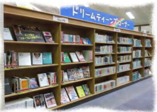
ドリームティーンズコーナー

（注3） 児童図書は、実際に内容を確認しないと選書ができないため、図書館職員や県内の子どもの読書に関わる方々の選書の参考にしてもらう目的で購入し、現物見本を展示している。（参考書、キャラクターもの、マンガ、ゲーム攻略本は除く）