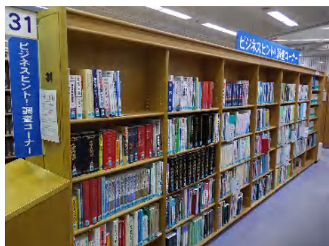
ビジネス・ヒント調査コーナー