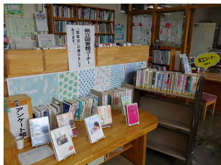
大山町立図書館名和分館に 設置された県立図書館コーナー