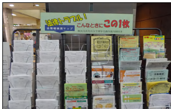
困りごとの解決支援のために作成された法情報検索マップのコーナー