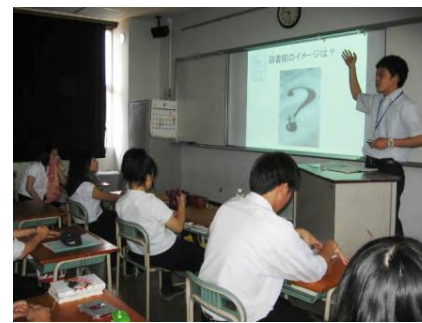
米子南高等学校で生徒を対象に 開催した『図書館活用セミナー』