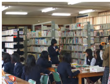
鳥取県立図書館の本を活用した授業風景（倉吉西高）