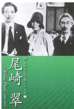
郷土出身文学者シリーズの刊行

環日本海交流室では、環日本海地域の図書館と協定を締結し、図書交換事業を行っています。また、各国の文化や歴史への理解を深めるため、環日本海講座や講演会も開催するとともに、大人向けの事業だけでなく、収集した絵本を活用して、外国語と日本語と絵本の読み聞かせを行い、子どもたちの国際理解を進める取組みもしています。この活動は、市町村立図書館にも広がってきました。