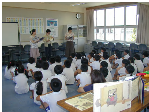
翻訳絵本の読み聞かせ風景