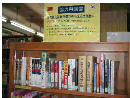
鳥取大学附属図書館で借りられる 県立図書館の環日本海交流室の図書